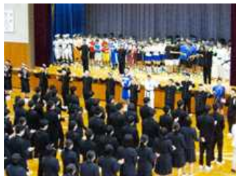
【←壮行式の全校応援】