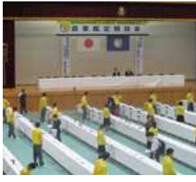
【新潟県農ク旗の入場→ 岡山県総合体育館】