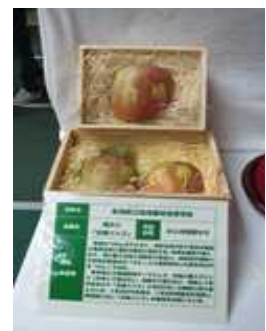
【↑合格リンゴを出品】