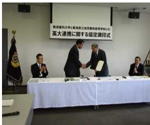
【新潟大学農学部 からの出前授業→】