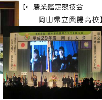
【←農業鑑定競技会 岡山県立興陽高校】

10月25・26日(水・木)、岡山県で、日本学校農業クラブ全国大会が開催され、全国から約4,000人の農業クラブ員が参加しました。