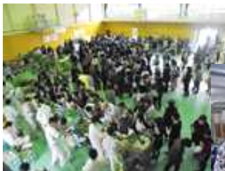
【←長蛇の列の農産物販売】