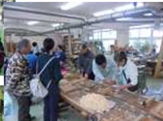
【↑緑地工学コースの 木工教室】