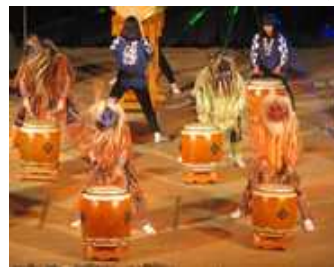
【←歓迎アトラクションの なまはげ太鼓】